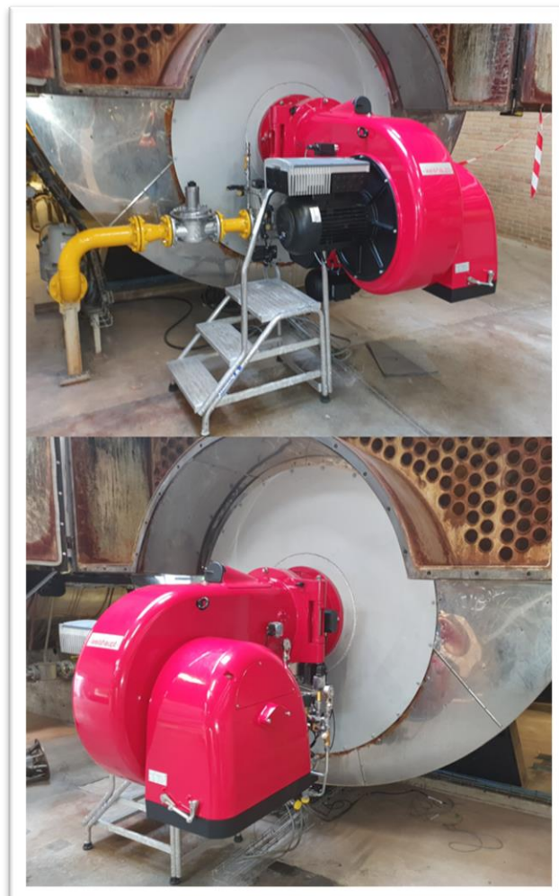
Brûleur avec tuyauterie gaz

"Créer quelque chose à partir de rien, voilà la devise de mon métier, à partir d'une tôle on peut créer un carter et d'un tube une tuyauterie. C'est un métier magique !"