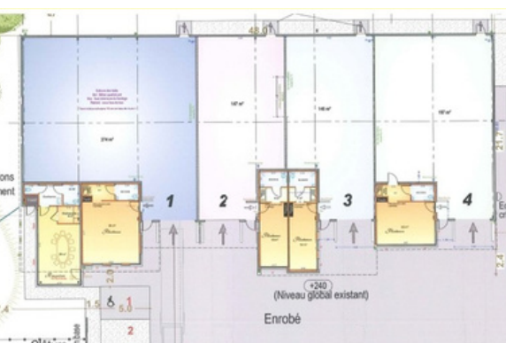
Plan du bâtiment relais n°2