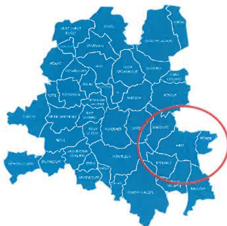
Localisation de la ville de Ham au sein de la Communauté de Communes de l'Est de la Somme

Le bassin de vie de Ham regroupe 48 communes et 21 024 habitants en 2019, soit plus de 4 fois la population de la commune pôle. Le pôle de Ham dispose donc d'un rayonnement correct sur un territoire relativement vaste.