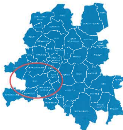
Localisation de la ville de Nesle au sein de la Communauté de Communes de l'Est de la Somme

La ville de Nesle compose, par ailleurs, avec la ville de Mesnil-Saint-Nicaise l'unité urbaine de Nesle, une agglomération intra-départementale regroupant 2 communes et 2875 habitants en 2019, dont elle est la ville centre.