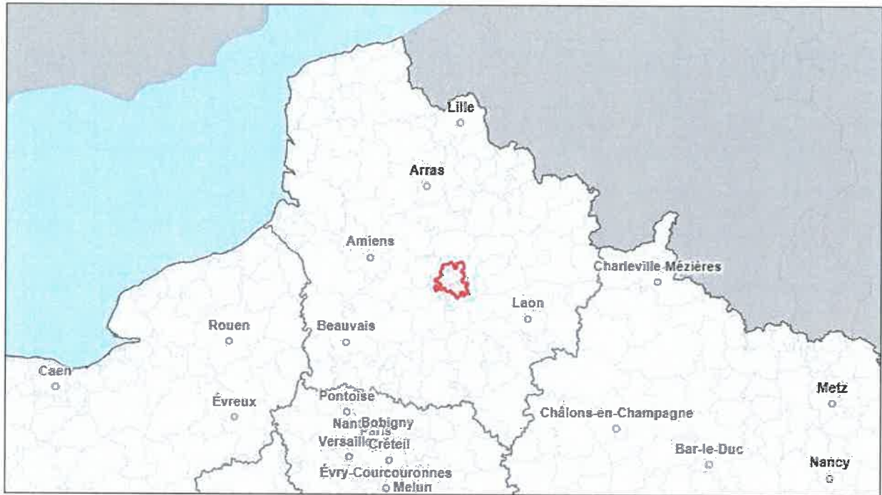
Localisation de la Communauté de Communes de l'Est de la Somme sur la Région des Hauts-de-France